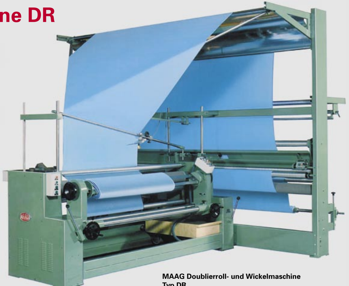
MAAG Doublierroll- und Wickelmaschine Typ DR

>>> Faltenfreie Wicklung mit sauberer Kante.